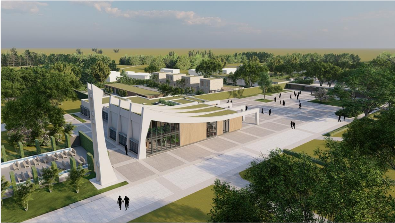
Anlage 2: Gestaltungsentwurf Modell B