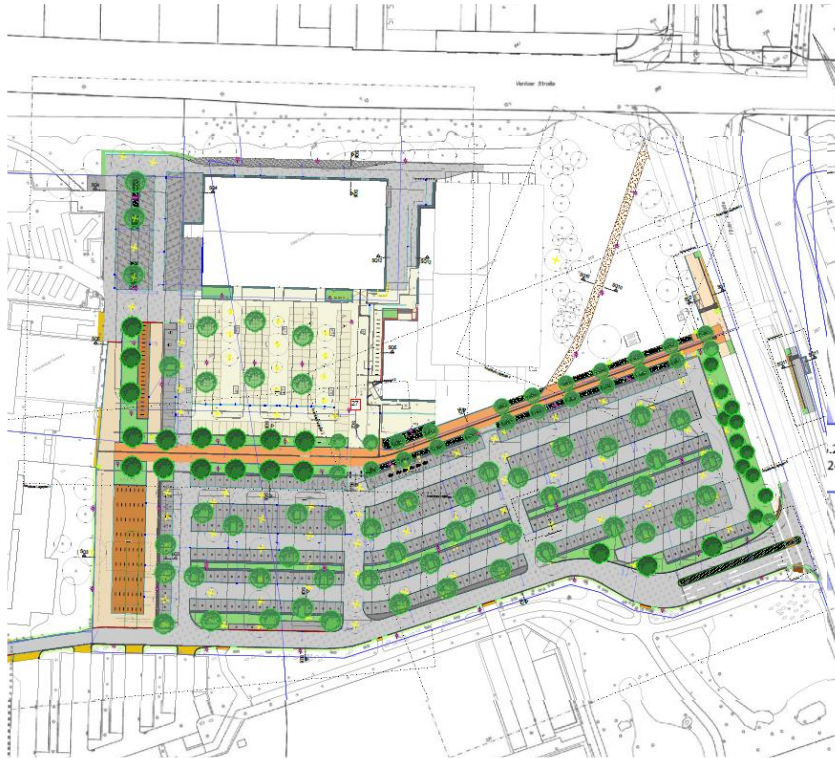
Bauablauf der 6 Bauabschnitte und Endzustand mit Grünanlagen