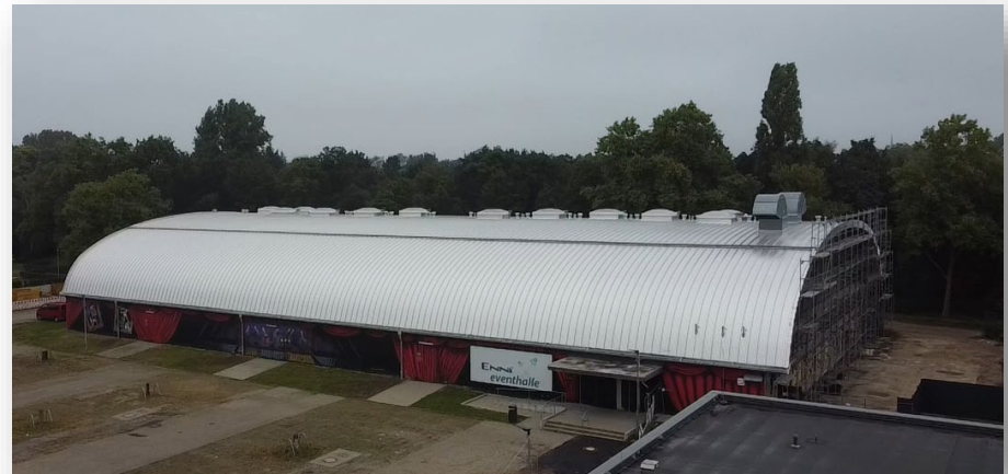
Zustand nach der Sanierung