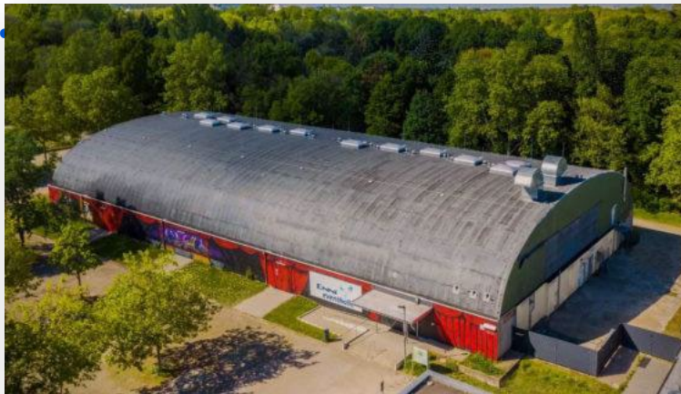
Zustand vor der Sanierung